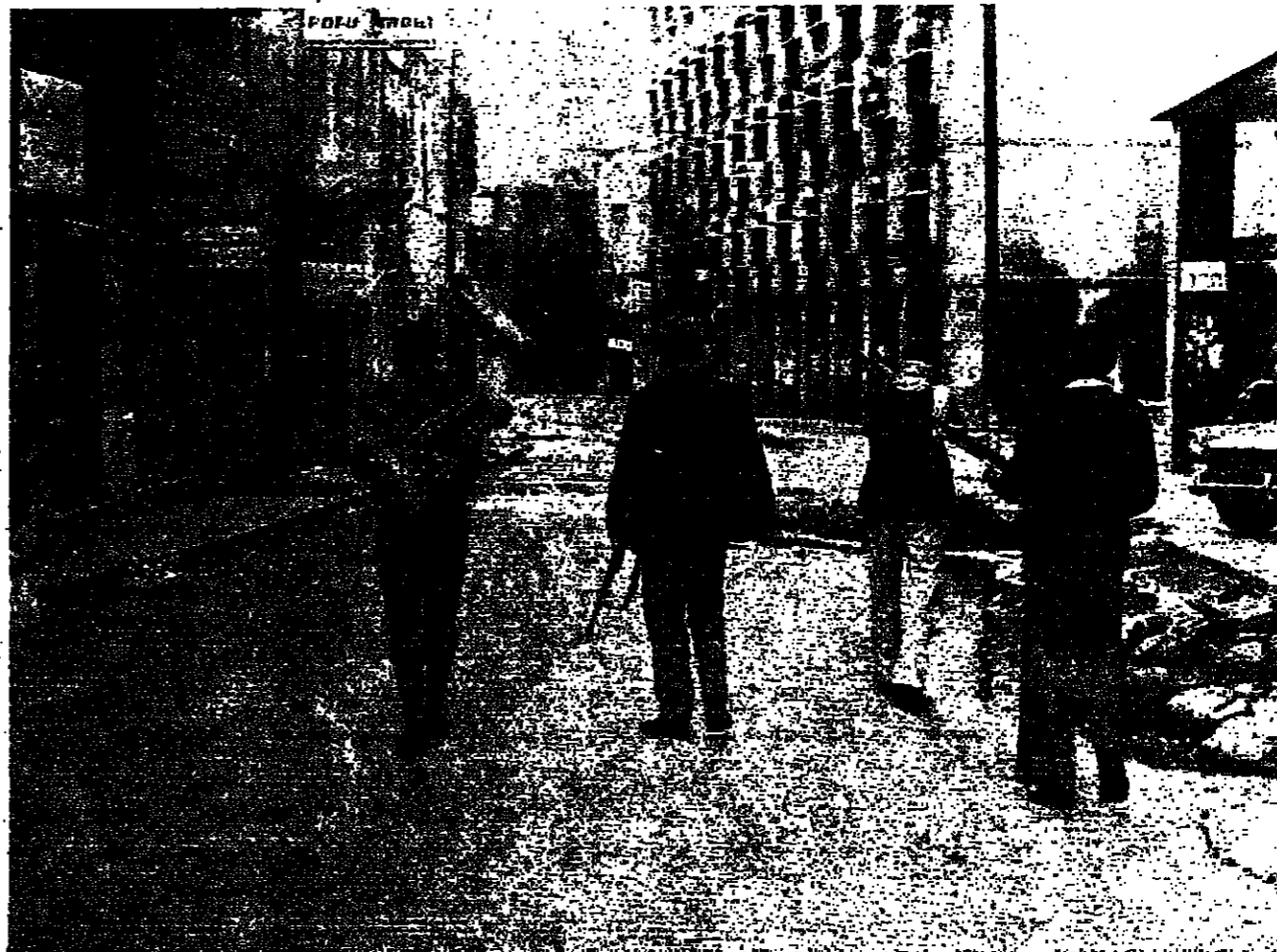
■ مسلحون تسرب بناصة للمعارزة